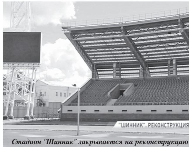
Стадион "Шинник" закрывается на реконструкцию.

Также на следующий год запланированы завершение строительства биатлонного комплекса в ЦЛС "Демино" и пристройки к школе №43 в Ярославле, окончание реконструкции стадионов "Шинник" и "Славнефть" к Чемпиона-